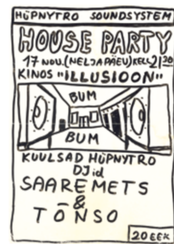
Lendleht Kalev K. erakogust