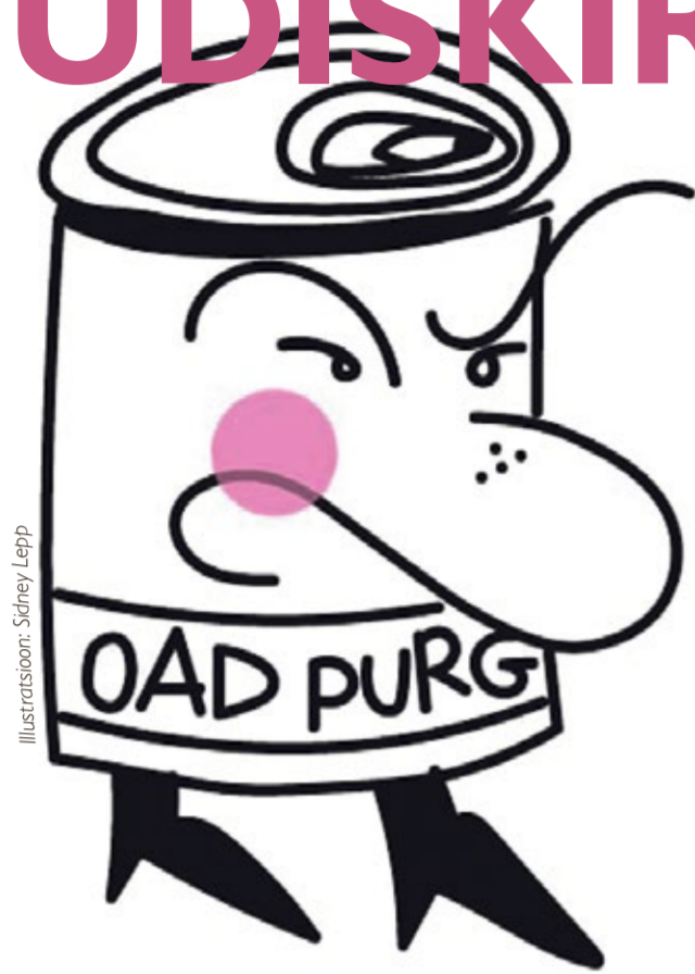
Illustratsioon: Siiney Lepp

Hommikul ilmus uudis, et naaber Ast on saanud ühistu esimees. Lapsed tahtsid kooli minna, aga A teatas, et täna on suur ühistu püha. Kogunesime tema korterisse ja vaatasime slideshow 'd ühistu esipere võidukast puhkuseraisist Egiptusesse. Lastele kingiti kuldseid sfinksid. Vanemad jäid naaber Ale teene võlgu ja tundus, et nii ongi mõistlik. Elukaaslane küsis, kuidas, kurat, me siia jõudsime? Otsustasin asuda olukorda lahendama.